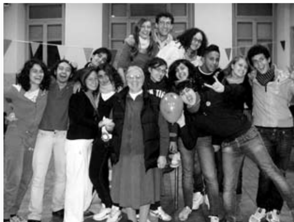
Il gruppo Biennio

L'Oratorio non è mai stato così vivo, così pulsante come durante l'estate ragazzi 2010: più di mille iscritti, ma soprattutto un centinaio di giovani che hanno partecipato alle iniziative proposte da Don Gianni, che si sono messi in gioco e, grazie al loro impegno, abbiamo potuto vivere un'estate meravigliosa e fantastica.